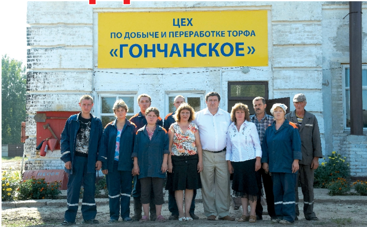
ЦЕХ ПО ДОБЫЧЕ И ПЕРЕРАБОТКЕ ТОРФА «ГОНЧАНСКОЕ»

- Еще одно направление деятельности хозяйства - выращивание ягод черной смородины. Первые саженцы посадили в 2007 году на площади 11,2 га, с годами сад расширяли: в 2008 г. посажено 21,5 га, в 2009 г. - 17,3 га. В настоящее время ягодник занимает площадь в 50 га. Для исключения ручного труда при сборе ягод приобрели два современных смородиноборочных комбайна, которые позволяют убирать ягоду качественно и быстро. В этом году было собрано 45 тонн ягод черной смородины, что в 2 раза больше первого урожая 2009 года. Ягода реализуется для последующей заморозки. В будущем планируется реализация ягод на экспорт.