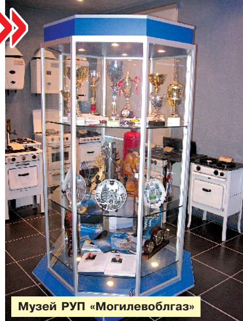
Музей РУП «Могилевоблгаз»

- Конечно, мы не можем оставаться в стороне, потому что жилье - это самое главное для каждого человека. Последний дом сдали в 2009 году. После этого заказали проектную документацию на следующий дом, планировали его строить, но стоимость квадратного метра в связи с финансовым кризисом стала для людей неподъемной. На этот год у нас запланировано полтора миллиарда на выделение займов для приобретения и строительства жилья. Конечно, есть определенные трудности в том плане, что мы можем финансировать стоимость квадратного метра только в размере, утвержденном городским или районным исполнительным комитетом, а он сегодня отличается в два раза от стоимости, которая получается по факту строительства жилья и стоимости квадрат-