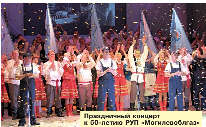
Праздничный концерт к 50-летию РУП «Могилевоблгаз»

Живое подтверждение этому - конкурсы профессионального мастерства, которые проводятся в том числе и с целью сплочения трудового коллектива. Ну а победители, конечно же, поощряются денежными премиями. В прошлом году на уровне республики среди предприятий Белтопгаза во